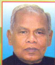
श्री जीतन राम मांड़ी मा० मुख्यमंत्री, बिहार

किसान जागरूकता महाअभियान-सह-स्त्री महोत्सव 2014