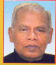
श्री जीतन राम मांझी मा० मुख्यमंत्री, बिहार

किसान जागरूकता महाअभियान-सह-श्वी महोत्सव 2014